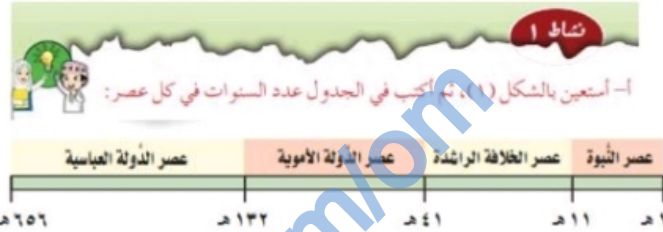
(الشكل (١) الدُولُ الإسلاميَّةُ حِثَّ حِثَّ (١) - ٦٥٦ هـ)